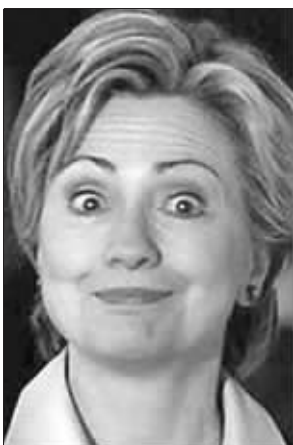
当个国务卿咋就这么难?

然而,“萨克斯比解决办法”却也饱受美国法律专家的谴责,许多批评者称,尽管这一方法可能尊重了法律的精