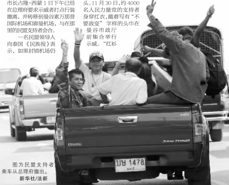
图为民盟支持者乘车从总理府撤离。