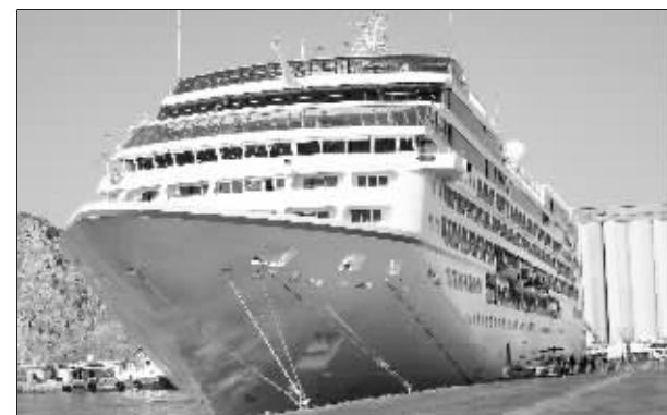
“诺蒂卡”号豪华邮轮