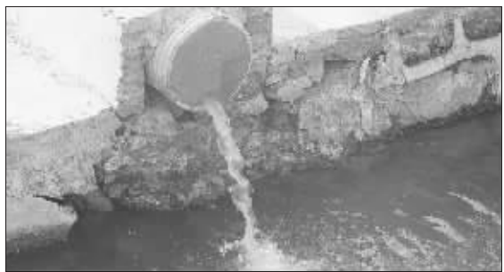
水管正向河中排放污水