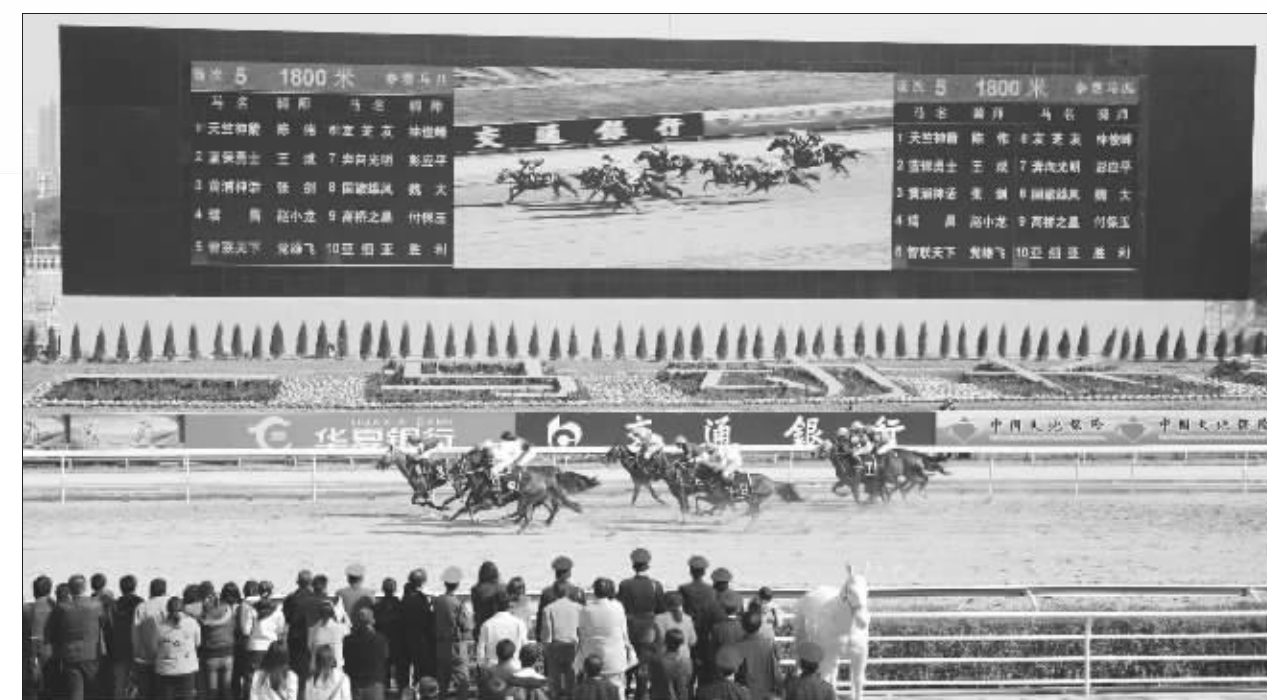
11月29日,武汉市民在现场观看赛马比赛