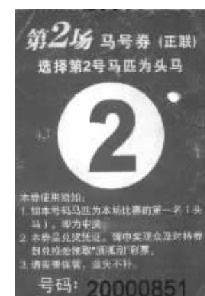
“马券”是中奖者的兑奖凭证

前几天的武汉,阳光明媚,但却无法阻止扑面而来的风吹得你不禁打个寒战。 但是如果你当时正坐在武汉东方马城的看台上,是肯定不会有这种感觉的,全场5000多人发自内心的热情,早已将这里点燃,所有人的目光和心脏都正随着赛道上飞奔的10匹骏马跳动。 这是第6届中国武汉国际赛马节开幕当天的情景,在中国内地首次推行竞猜型赛马(由于马彩目前还没有正式在内地开展,所以圈内都将这种类似于马彩的赛马比赛称为竞猜型赛马)显然引爆了无数人的热情,那种通常在港剧中才能看到的令人心潮澎湃的跑马的场面,第一次在中国内地上演了。从这一点上来说,“马彩”在中国内地的试水是成功的,而这正是“马彩”在内地开禁迈出的最坚实的一步。