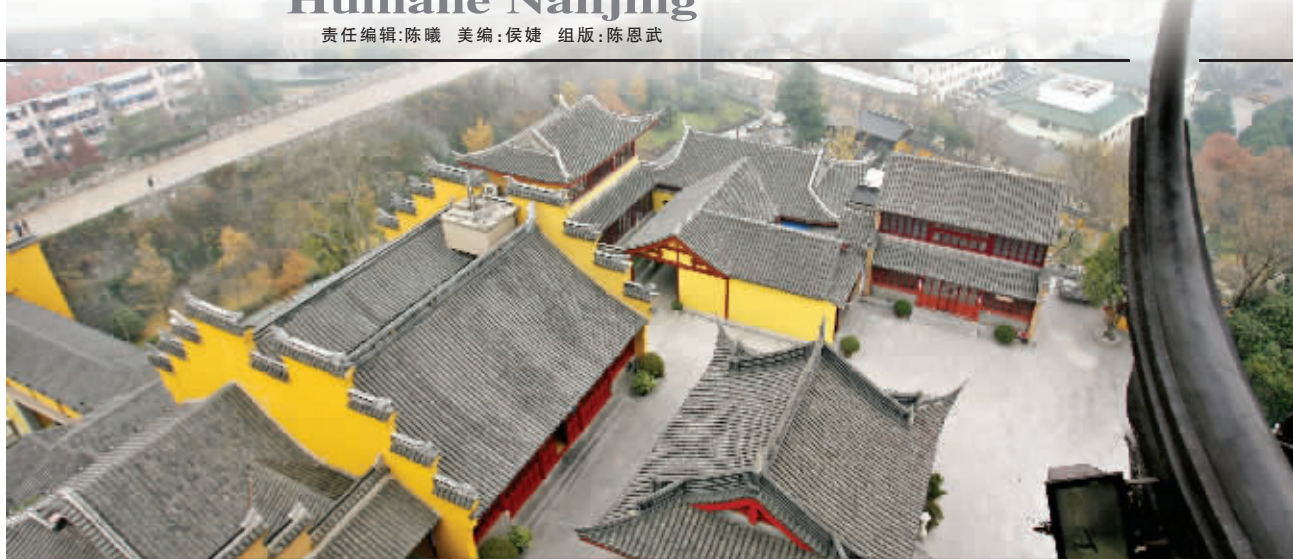
大隐于市的鸡鸣寺,见证了这座城市千年的沧桑变迁