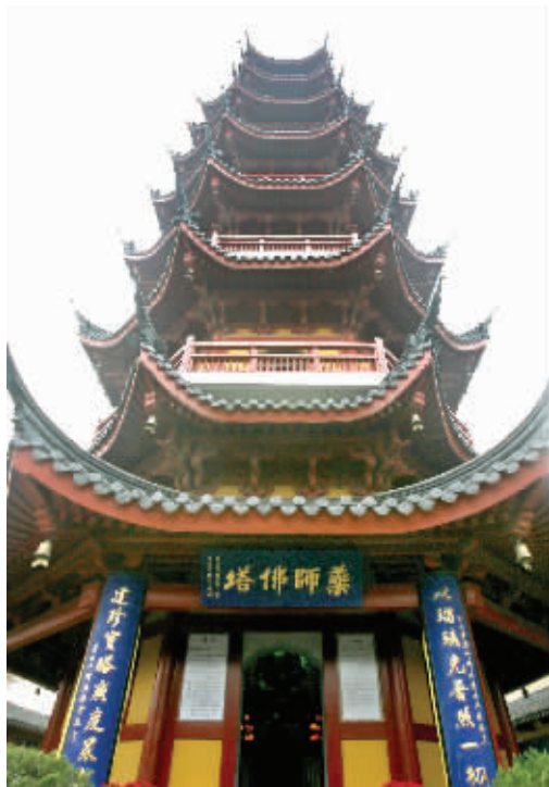
鸡鸣寺香火旺盛,药师佛消灾延寿