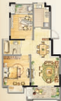
82m 2 精致两房