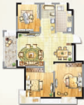
104m 2 优雅三房

凡在12月5日-12月14日期间购买大地·伊丽雅特湾80m 2 以上房源的客户,均可享有价值5万元的西班牙浪漫双人游,为您全面开启西班牙奢华之旅!