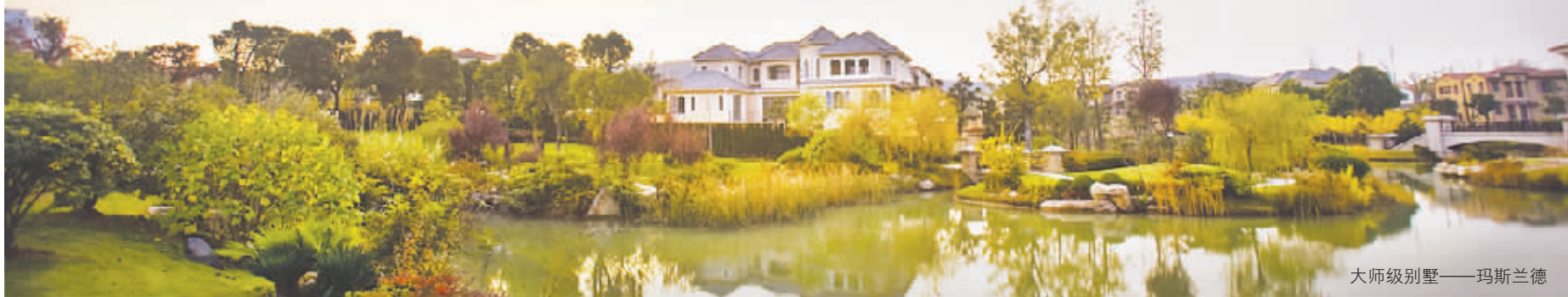
大师级别墅——玛斯兰德

作为已完全成熟、现房销售的玛斯兰德,其品质经得起客户挑剔的检验。如今,每天都有不少客户前来体验社区的人文氛围,以及其环境、配套、服务,特别是正在开放的海枣树样板间,观摩者更是络绎不绝。这是玛斯兰德对产品品质与社区环境、服务水准的自信,更是一种大方气度的彰显。