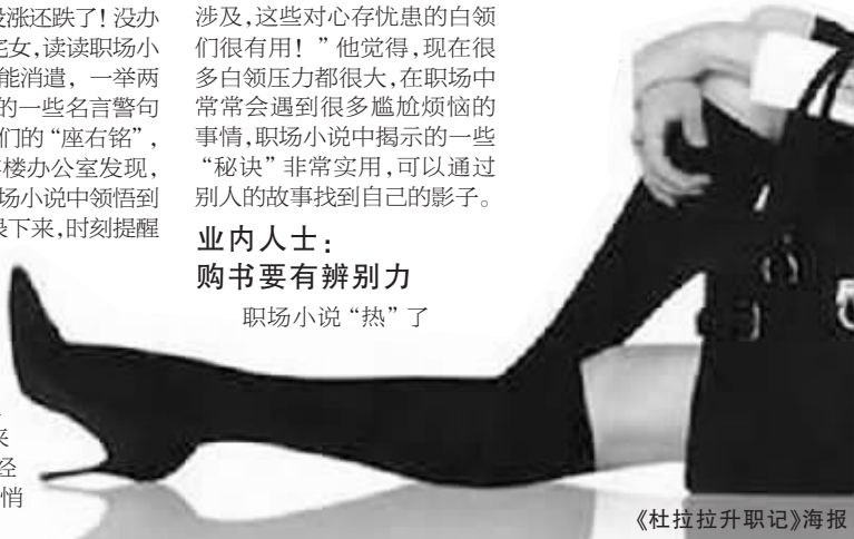
《杜拉拉升职记》海报