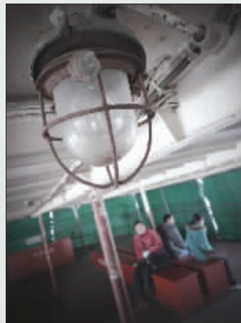
渡船内的灯罩留下岁月的痕迹