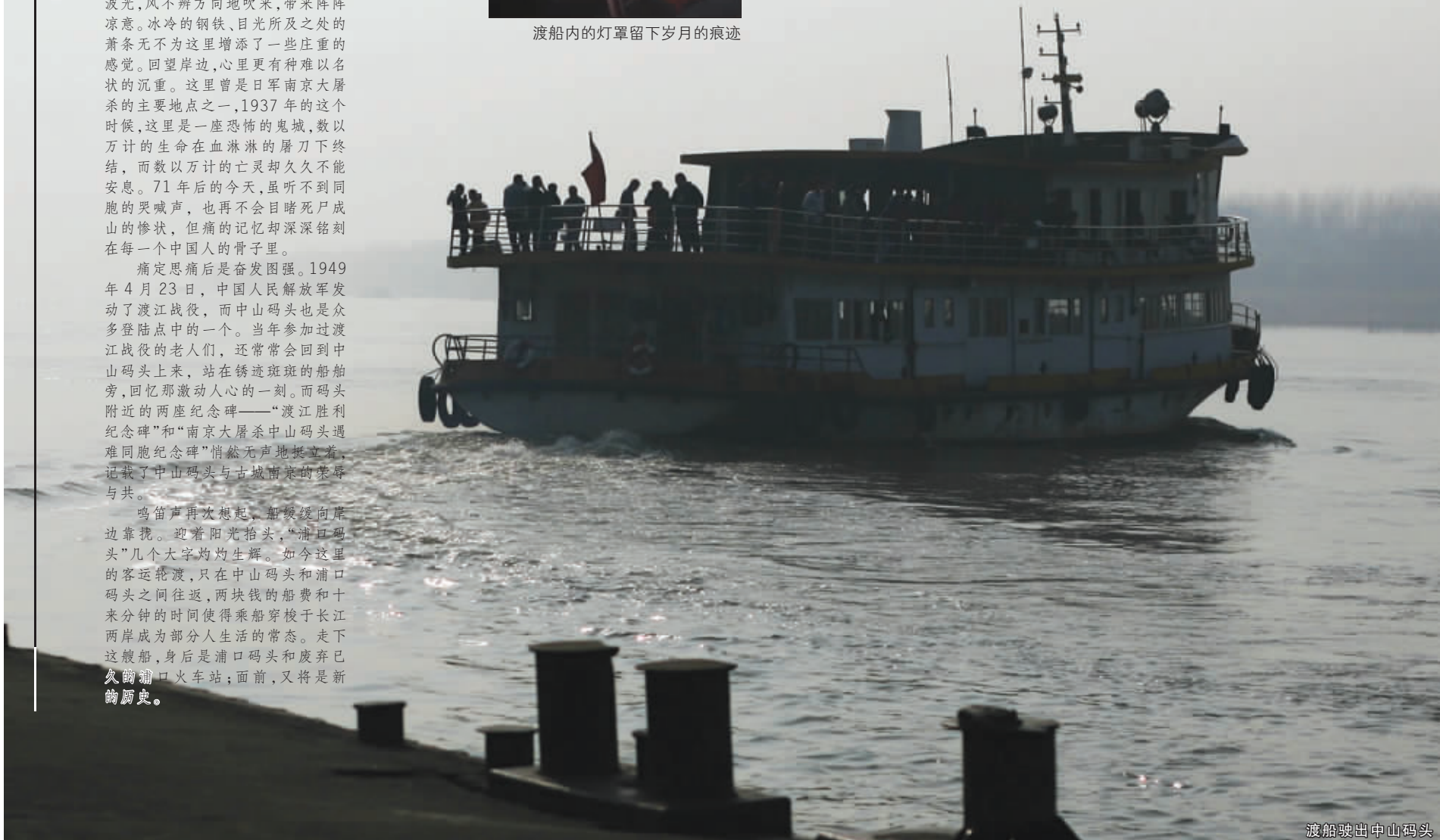
渡船驶出中山码头