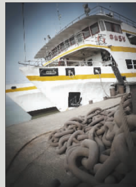
解开缆索,渡船起航。历史在继续,中山码头又将翻开新的一页。