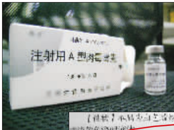
◀小玻璃瓶内装的就是神奇的肉毒素