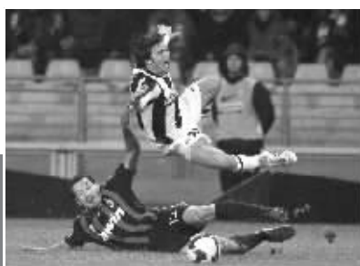
尤文图斯4:2AC米兰。尤文的赞布罗塔(下)飞铲德切列。