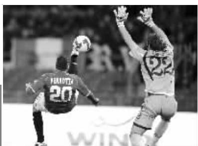
罗马3:2卡利亚里。罗马球员佩罗塔倒钩破门瞬间。