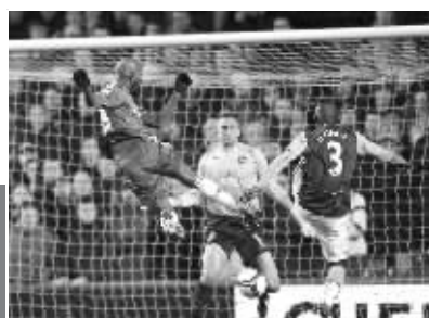
切尔西1:1西汉姆。阿内尔卡打入英超第100个进球瞬间。