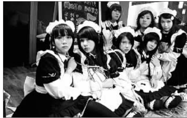
可爱“女仆”为您端茶递水

进门叫你一声“主人”,以女仆的身份为客人端茶、陪客人打牌,给客人营造一种主人的感觉,这就是日本ACG(动漫、动画、GAL游戏爱好者)迷们喜欢的女仆咖啡店。24日至28日,在南京文化艺术中心内,以女仆餐厅为代表的第二届江苏东方国际动漫节将正式拉开序幕。江苏都市网进行8折门票团购活动,拨打96060即可订票,圣诞专场更在八折优惠之上再送圈币,圣诞节百元就能过把动漫瘾。