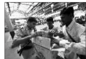
警察在孟买CST火车站检查旅客行李

经过3个多星期整修,两家饭店选择在本月21日同一天重新开业。安全部门当天在两大饭店附近加强了安保措施。当天所有进入奥贝罗伊饭