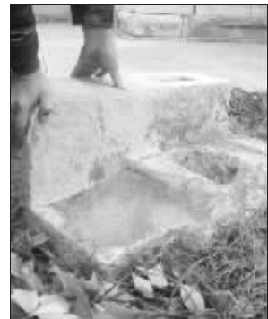
从大金门边上挖出来的石刻

昨天上午,记者联系了中山陵园管理局,文物处一名工作人员表示,这3件石刻是他们前不久在维护和清理大金门