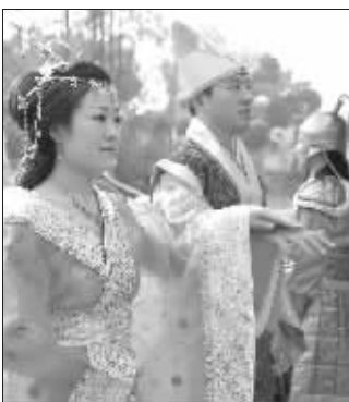
▲新郎扮演太子,新娘扮演太子妃,两人在“侍卫”的护卫下,步入码头。