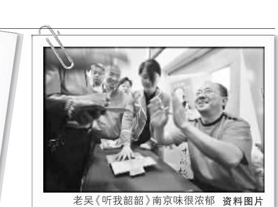
老吴(听我韶韶)南京味很浓郁 资料图片

12月22日,苏州确定6位方言发言人的消息,引起人们对江苏方言的关注。江苏省处于南北交会之地,南跨长江,北过淮河,各地语言变化丰富多彩。时下,江苏省第二批省级非遗正在申报。作为全国最复杂的语言大省,有专家提议,江苏方言应该列入非遗之列。不过,非遗专家们也认为,方言和普通话的推广有矛盾性,如何既保护原汁原味的方言,同时也把普通话推广开便于人们交流,目前还是一个难题。