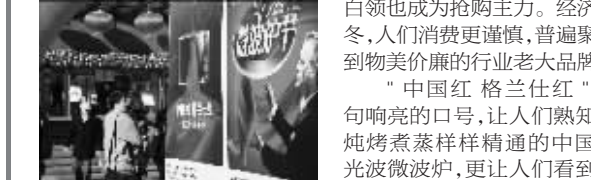
微波炉完成烹调后的清脆

最新消息 节能、智能的微波炉省钱、省工夫,成为广大市民过冬的“法宝”,连长期下馆子的白领一族,也争相将健康可口的微波炉DIY饭菜作为“一日三餐”首选。午餐时刻,走进许多写字楼、办公室,微波炉完成烹调后的清脆