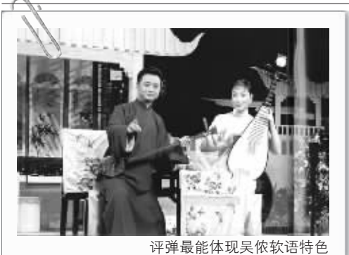
评弹最能体现吴依软语特色