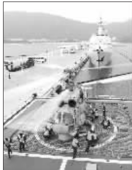
直升机组人员在保障训练

中国海军护航编队舰载直升机组负责人孙自武26日在接受记者采访时说,世界各国的实践表明,直升机已经成为反海盗行动中的重要武器。