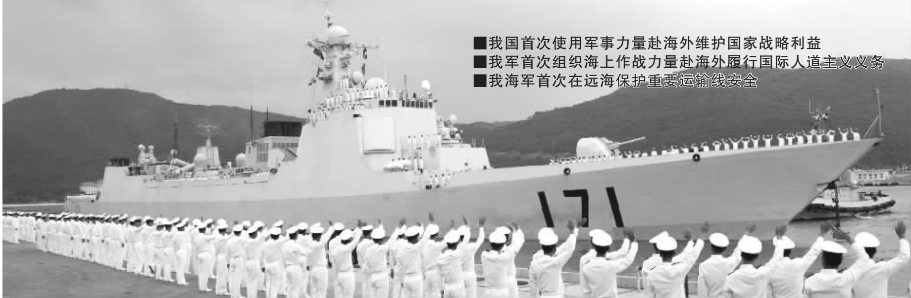
昨天下午,海军官兵在三亚军港为出征军舰送行。