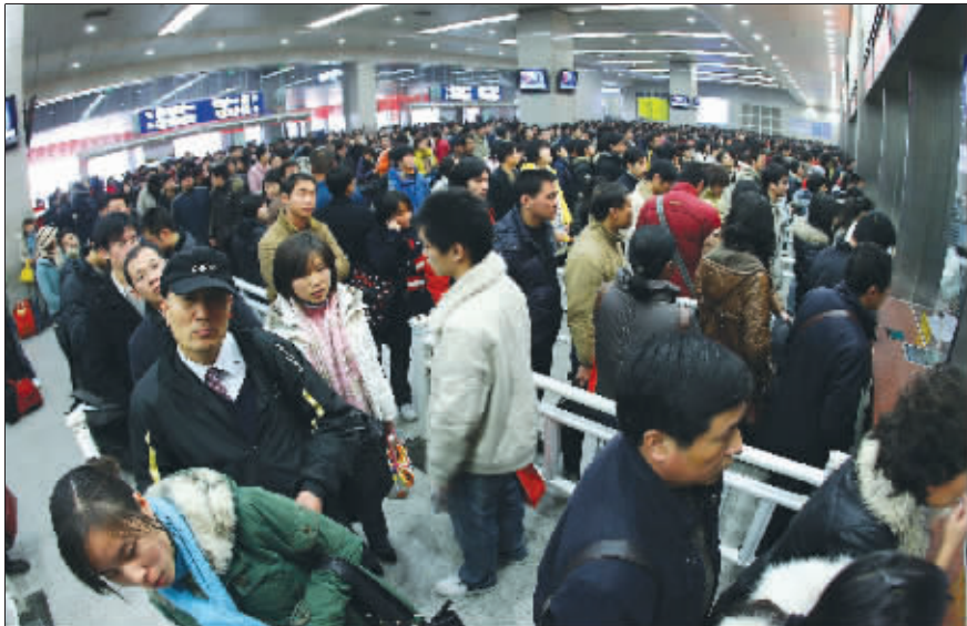
队排得那么长,票不知还剩几张

虽然还没进入春运,但火车站已经“黑压压”一片到处都是人。每个售票窗口都排起了长队,可是票情滚动屏上一条条显示无票的横杠却沉重地压在旅客的心头。“没有票了,排队买不到,订票电话打不通,怎么办?”这是售票大厅里随处都能听到的一句话。南京火车站相关人士提醒,其实最简单的办法就是网上预订车票,他们一小时内肯定有回复。