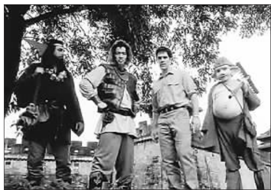
欧美版《西游记》师徒造型

观音爱喝马爹利;唐僧变成了高大英俊的美国学者;孙悟空还是照样被压在山下,不过是座蒸汽山;猪八戒居然减肥瘦得可以看到排骨——这就是欧美版《西游记》,角色也雷人得可以。不过,这却不影响观众的痴迷。