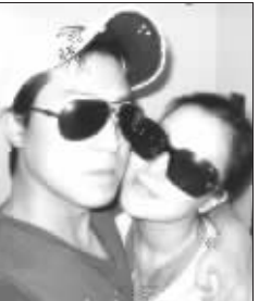
金喜善(右)与丈夫合影

和很多人口中的艺人也不一样,不仅与自己的儿子相敬如宾,孩子出生前的准备工作也都是自己亲手打理的。