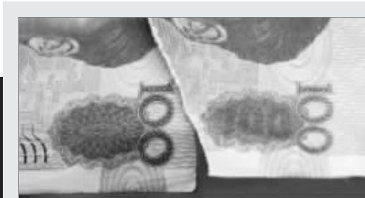
左边是真钱,只有在特殊角度下才能看到100的字样。右边是假钱,任何角度都能看到100的字样。

有一种假钞,连验钞机都验不出来!您别不信,近日,广东、四川、浙江等地都发现了以“HD90”开头的高仿真百元假钞。记者昨日了解到,南京早在去年就发现了“HD90”开头的假钞。