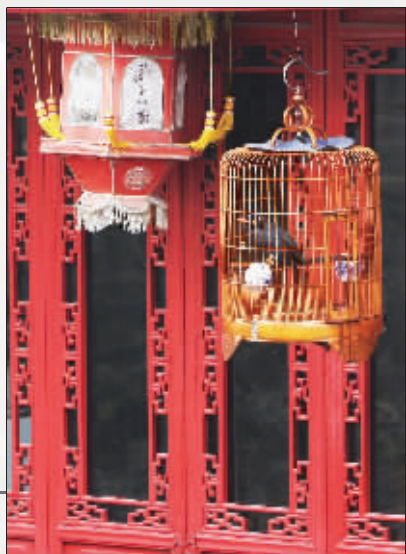
鸟笼和灯笼,都是夫子庙的标志