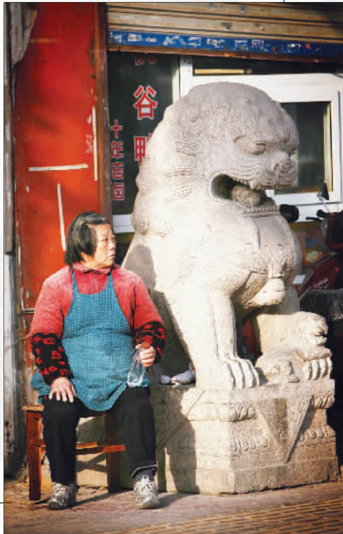
坐在石狮旁,晒晒太阳,老城南居民的一大生活享受