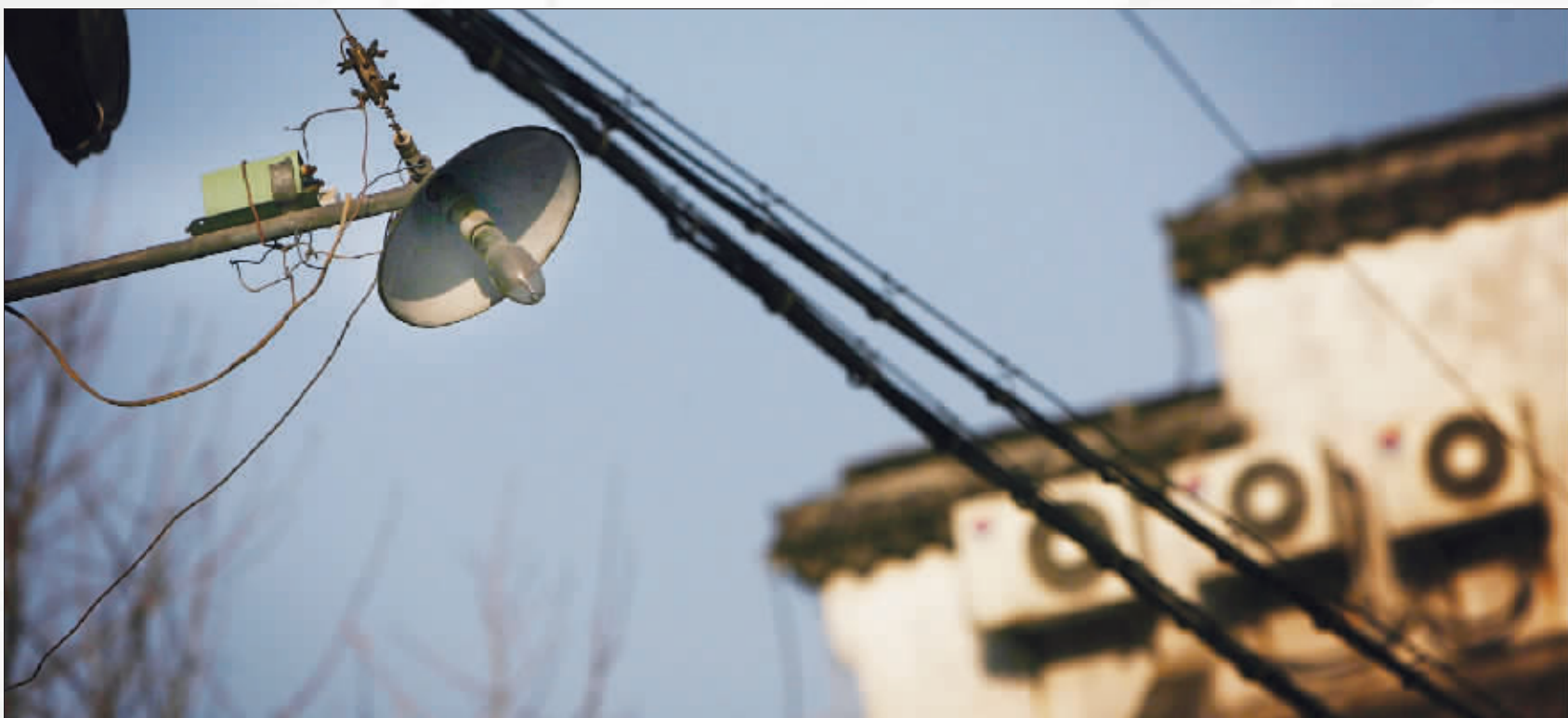
城南最常见的马头墙和“古老”的路灯相映成趣