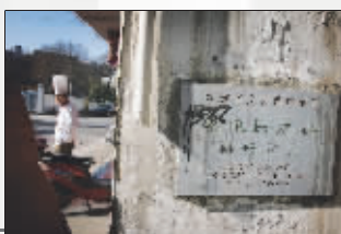
“棋峰试馆”如今是一家酒楼