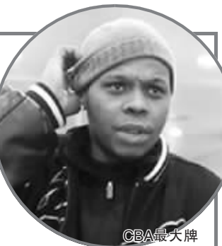
CBA最大牌外援威尔斯

杰森似乎忘了,客场与万马的比赛,江苏队在上半场落后近20分的情况下,下半场一举击溃对手,靠得就是联防。“斯奈德的突破非常犀利,但他的投篮确实不怎