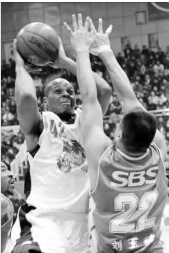
威尔斯(左)很勇猛,南钢能防住他吗?

今日之CBA,最大牌的外援是谁?姚明前队友、火箭前明星、绰号“棒子”的威尔斯自然当仁不让。威尔斯昨天抵达南京,今晚他将代表山西队与江苏南钢作战一番。这个“棒子”当然是江苏队最忌惮的球员,不过,江苏队早已准备好了杀“威”棒。