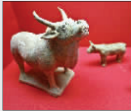
古墓中出土的陶牛