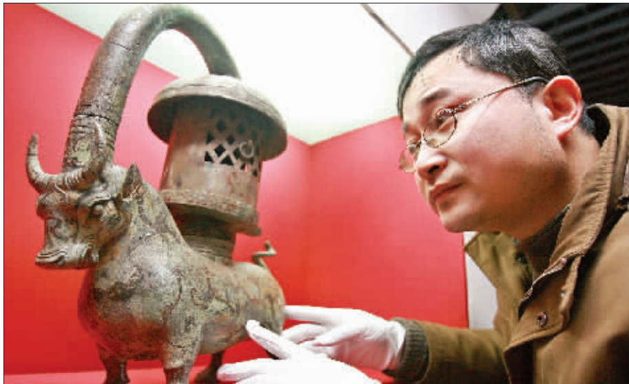
这件错银铜牛灯是南博的镇馆之宝,平时看不到

为了迎接牛年,南京博物院特意从 44 万件藏品中选出了 70 多件和牛有关的展品,在春节期间展出。从东汉的铜牛灯,到 900 多年前的《四季牧牛图卷》,再到现代的牛紫砂,从古到今看起来,只有一个感觉:真的很牛!