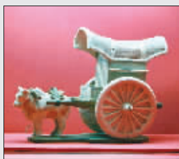
到了唐代,牛车依然是身份的象征