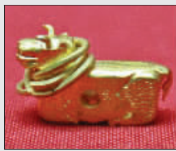
虽然只有指甲大,你别小瞧它,它是纯金打造的