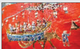
光绪皇帝结婚时用的喜帐