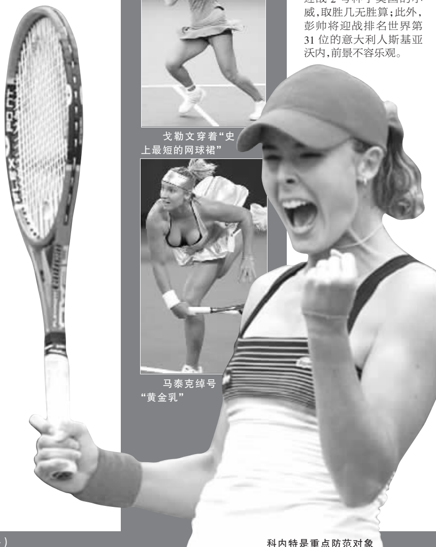
科内特是重点防范对象