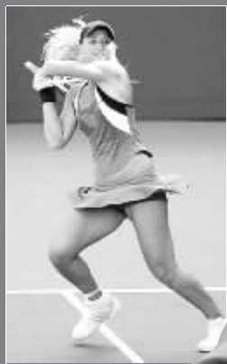
戈勒文穿着“史上最短的网球裙”