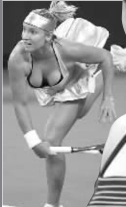
马泰克绰号“黄金乳”