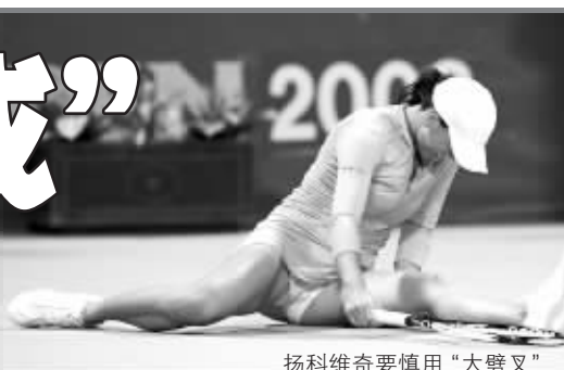
扬科维奇要慎用“大劈叉”