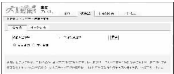
赶集网关于暂停火车票转让公告 (截屏)