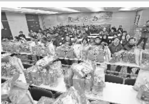
一份份分装好的年货