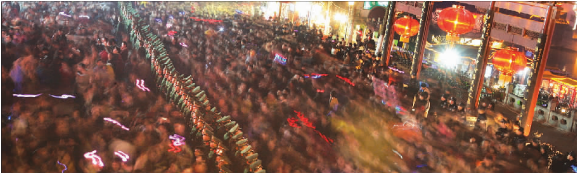
去年元宵节,夫子庙景区人山人海,令人胆战心惊,大批公安干警和武警官兵赶至现场维持秩序。