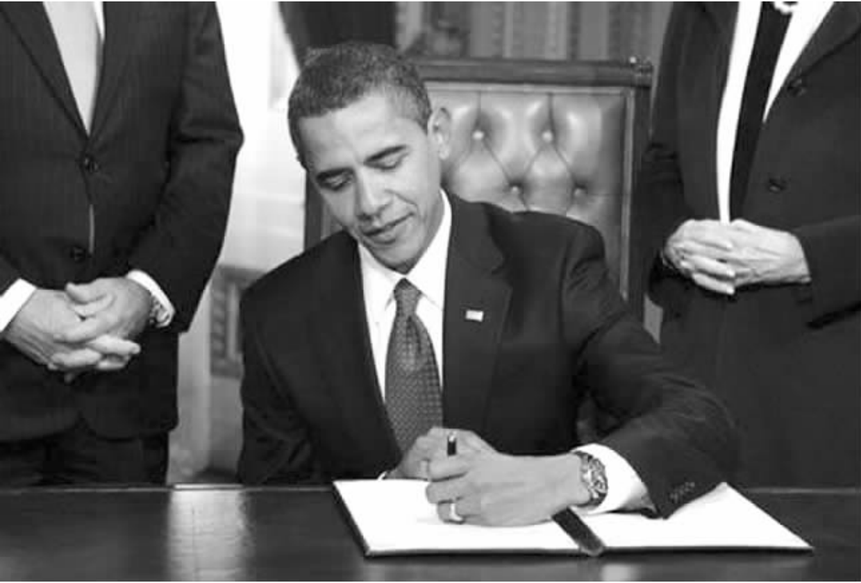
奥巴马上任后第一次签署文件