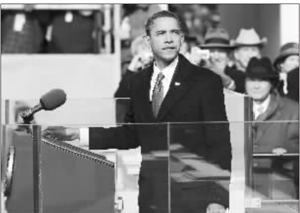
奥巴马在就职仪式上发表就职演说。