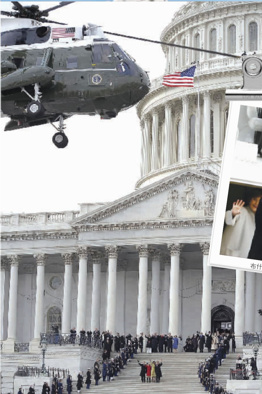
20日,奥巴马夫妇和拜登夫妇(下中)挥手送别布什搭乘直升机离去