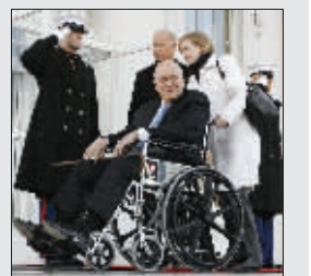
切尼坐着轮椅出席典礼