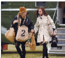
布什的双胞胎女儿