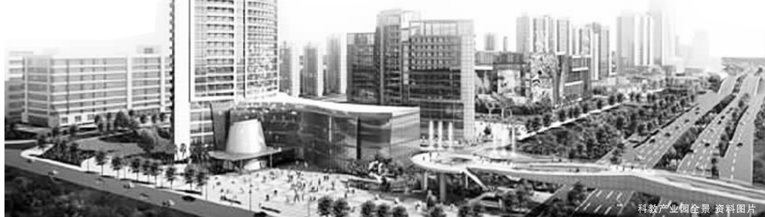
科教产业园全景 资料图片

本次招录人员年龄35岁以下;报考镇(街道、园区)事业单位职位的均须具有本市户籍;报考市机关部门所属事业单位职位的,除全日制硕士以上研究生和2009年应届未就业毕业生外,均须具有本市户籍。考试将按笔试-专业测试-面试的程序进行,由宜兴市组织人事部门统一组织实施。招考工作咨询电话:87986253。事业单位公开招聘工作参照《江苏省国家公务员录用监督办法》接受纪检监察部门和社会的监督,监督电话:87986221。 陆媛