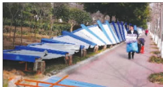
昨天,龙蟠路上一排围挡被狂风吹翻。