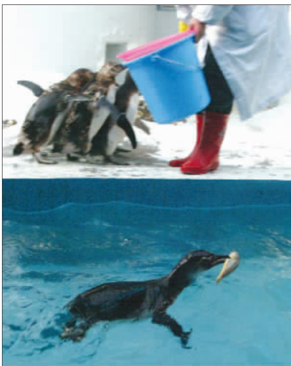
六只小企鹅已经接受了中国口味