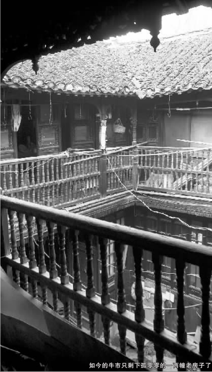
如今的牛市只剩下孤零零的一两幢老房子了

今年,这里只剩下两户人家。昔日的老邻居早就陆续搬走,虽然都留下了联系电话,偶尔也回来看看,然而街渐渐不成街了,只剩下孤零零的几幢房子,可看的越来越少,他们来的次数也越来越少。牛市,变得很寂寞。