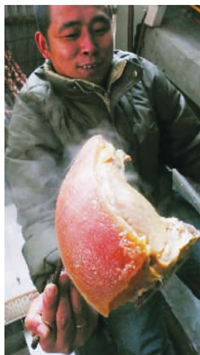
好大的肉,好香的味儿