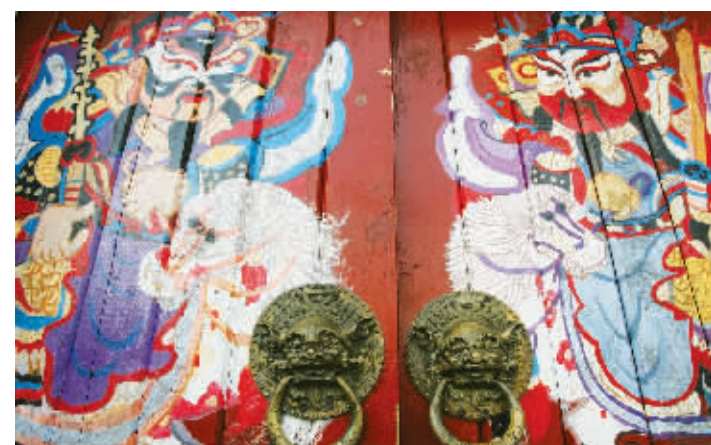
老城南还保留着贴门神的习俗