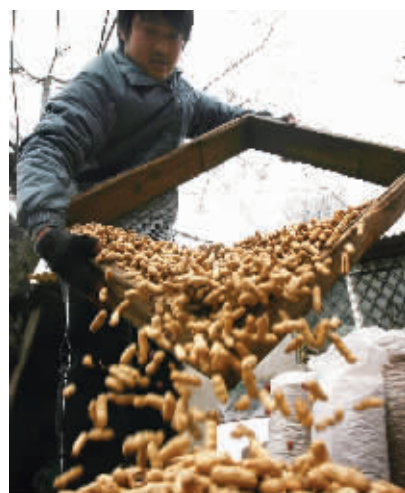
吃花生,来年又是丰收年