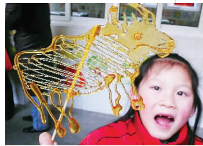
糖稀牛最招小朋友喜爱