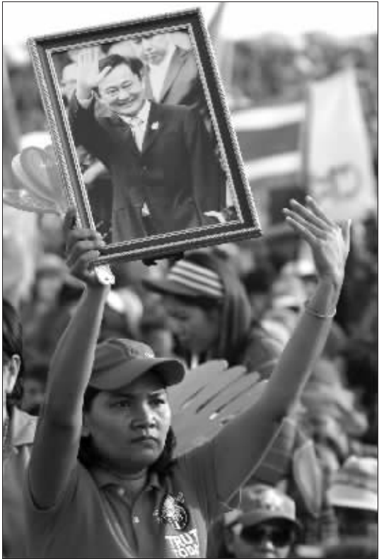
一名“反独联”示威者高举前总理他信的头像