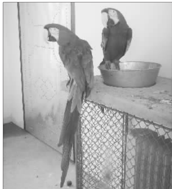
今年可能“添喜”的万元金刚鹦鹉

据悉,本次洽谈会将提供缝纫工、机械加工、电焊工等在外的数十个行业的1200多个境外就业岗位。苏州市外经贸局、苏州市公安局出入境管理部门届时将提供现场咨询服务。据苏州市人力资源市场相关负责人介绍,今年是苏州首次举办该类型的招聘会。“在国内就业形势严峻的情况下,让劳动者走出国门是解决就业问题的一个新途径。”据介绍,此次洽谈会所提供的岗位在学历和技能方面要求较低,具备一定劳动技能且能够吃苦耐劳的应聘者都有机会出国务工。何寅平