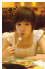
▲王宝强与女友很亲密