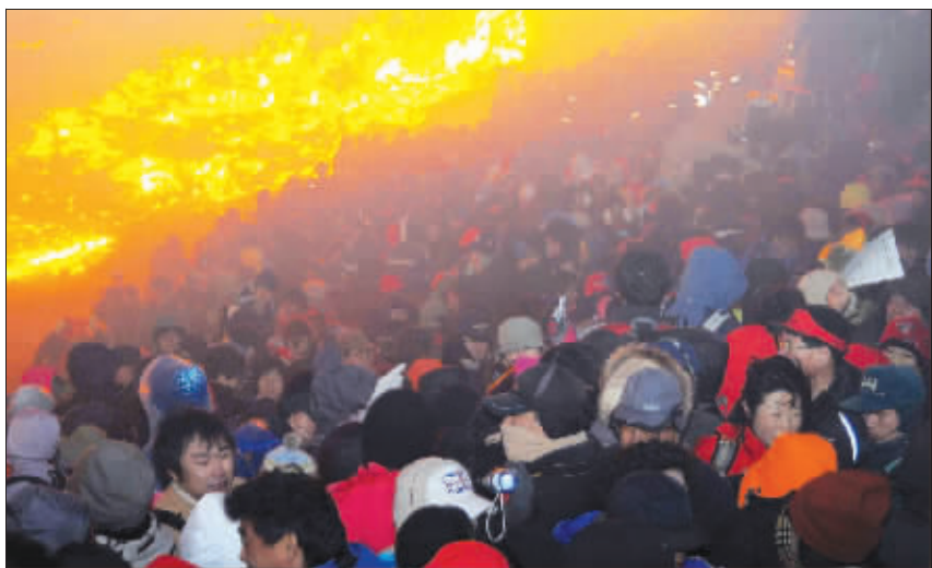
人们在正月十五传统的“烧蒲苇”活动引发火灾后四散逃离

新华社首尔2月10日电(记者李拯宇 于玉兰)据韩国媒体报道,韩国南部庆尚南道昌宁郡9日晚发生火灾踩踏事件,截至当地时间10日晨,至少4人在事件中死亡,另有60多人受伤。当地官员说,9日傍晚,昌宁郡火旺山举行正月十五传统的“烧蒲苇”活动。18时