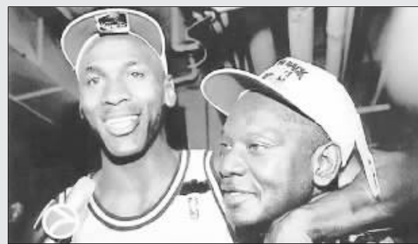
乔丹和父亲(右)感情很好,不知这次作何感想?