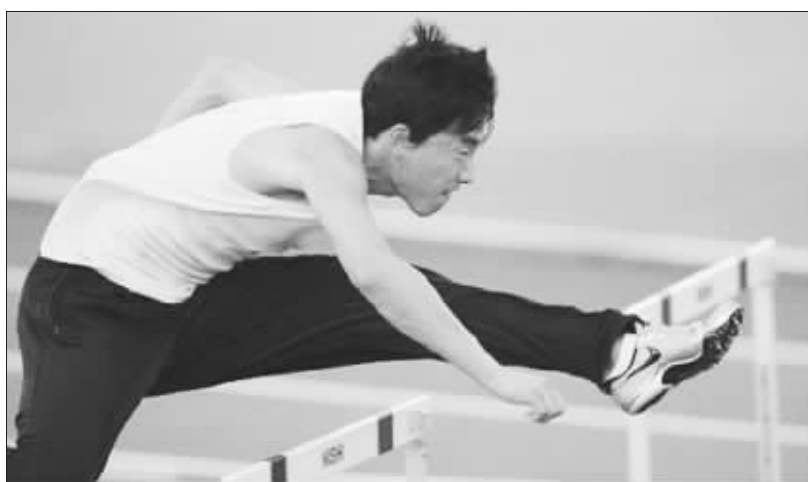
刘翔进行跨栏训练可能要等到国内