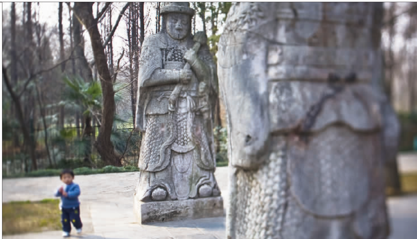
翁仲路神道,守陵的石像无语站立,兜兜转转,数百年已经过去