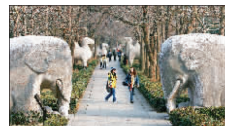
神道并非直线,据说是为了避开孙权的陵墓