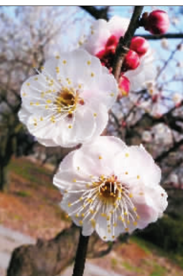
满山的梅花,有多少留在了赏花人的镜头里