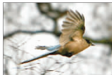
梅花山少不了它们的身影