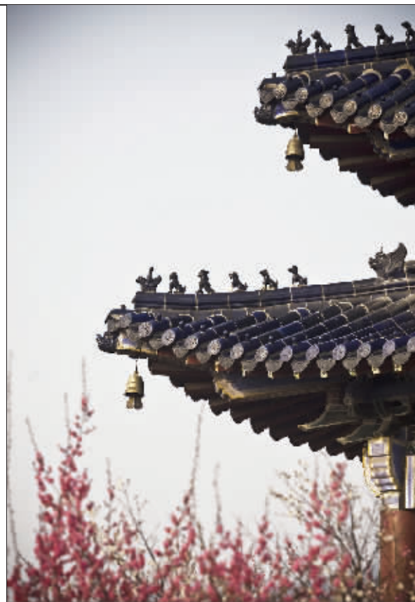
檐角的风铃,在山风里偶尔发出一声清脆的声响