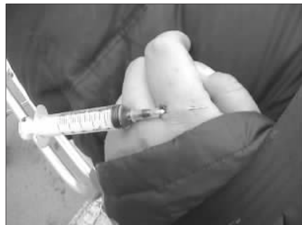
男子手上插着针管

民警查勘现场后表示,这名男子存在长期注射毒品的嫌疑。目前,警方正在进一步调查此事。(蔡先生报料奖60元)