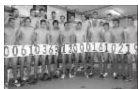
贝加索球员们用“绝招”

快报讯 最近一段时间,西班牙地区联赛球队贝加索成了媒体报道的焦点。这支球队的球员们已经3个月没能拿到1欧元薪水了,为了向俱乐部抗议并向全社会求助,贝加索球员们连续播出了两大爆炸性新招。