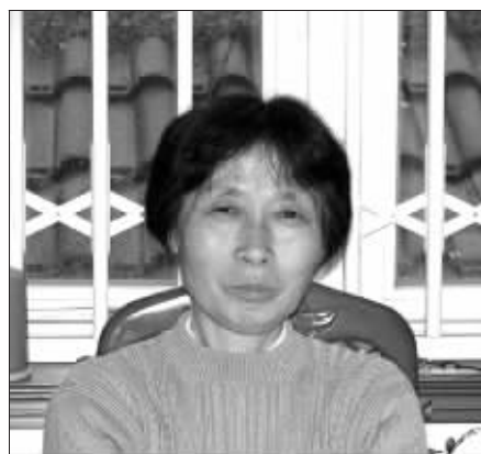
茅女士走失的母亲

茅女士是南京某外语学校的老师,元宵节那天,她的母亲在与父亲坐公交来她家的路上,突然走失。连日来,一家人想尽办法也没有找到母亲。想到自己是初三毕业班的班主任,怕耽误学生学业,茅老师强忍悲痛,每天坚持到校上课。学生们也自发组织起来,利用周末时间,到街头散发寻人启事,衷心希望老师的母亲早日回家。