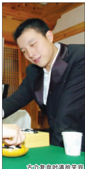
古力复盘时满脸笑容