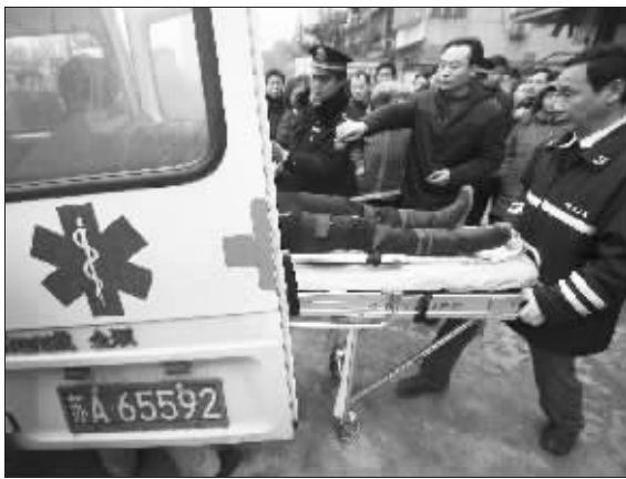
跳楼女孩被抬上救护车

“唉,这个女的太激动了,怎么劝说都没用啊!”现场参与劝说的一位民警说,当时女子在上面多次做出危险动作,众人在里面劝说,喊她的名字,她大声说:“我不要听!”然后还说:“我死的样子一定很难看,你们要把