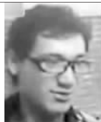
▶视频最后出现的男子特写

3月3日记者调查发现,视频中呈现的情形确实发生在广州机场路某自助银行前,但“眼镜男”并未拿走取款男子的钱,其目的似乎只在故意伤人,警方目前将该案列为治安伤人案件处理。