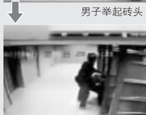
男子狠砸下去(均为视频截图)