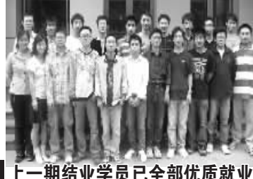
上一期结业学员已全部优质就业