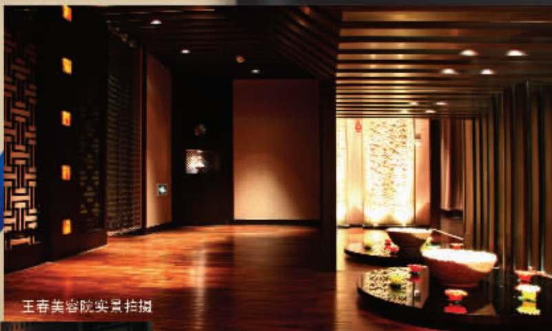
王春美容院实景拍摄