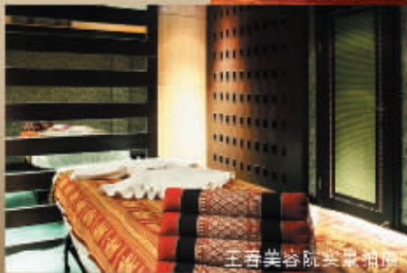
王春美容院实景拍摄