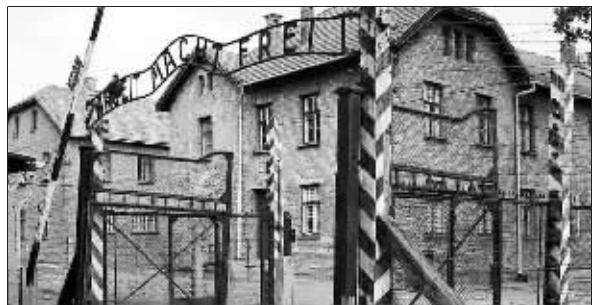
臭名昭著的奥斯威辛集中营(资料图片)