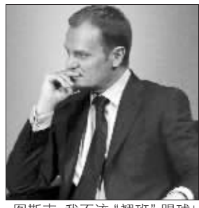
图斯克:我不该“翘班”踢球!

美联社报道,年过半百的图斯克是个球迷,经常和朋友一起踢球比赛。对于图斯克“翘班”踢球的报道,波兰总统莱赫·卡钦斯基嘲讽道:“比分多少?总理先生进球没有?”