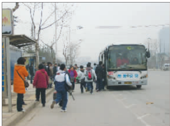
46路车一来,等车乘客蜂拥而上

近日,记者在早晚高峰分别体验了一把,着实感受到乘客们形容的“46路公交如此不可救药”的滋味。