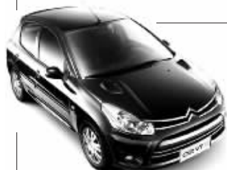
▲东风雪铁龙 C2 (资料图片) ▶法国原装雪铁龙 C6 (资料图片)