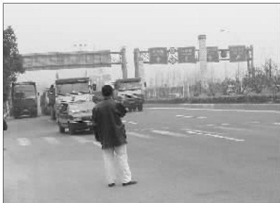
行人横穿通江大道

高速路口,来往车辆的速度几乎接近在高速公路上的行驶速度。要在这些路段穿越通江大道,只能用“惊心动魄”“险象环生”来形容,年轻人每次穿越时都要出一身汗,更不用说老人和儿童了。因为南北走向的通江大道从锡通村中间穿越,正好将锡通村分隔成东西两部分。锡通村的居民在日常上班、上学、买菜,甚至坐公交车时经常要频繁穿越通江大道,平均每个居民至少每天需要穿越2到4次。其实,锡通村路段附近设有桥洞,但桥洞离锡通村路口较远,一般来