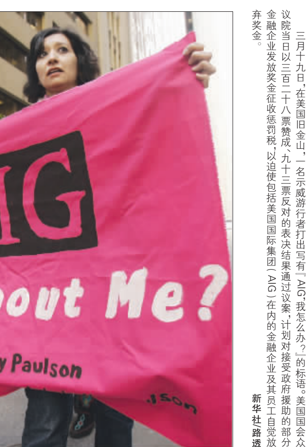
三月十九日，在美国旧金山，一名示威游行打出写有“AIG我怎么办？”的标语。美国国会众议院当日以三百一十八票赞成、九十三票反对的表决结果通过议案，计划对接受政府援助的部分金融企业发放奖金征收惩罚税，以迫使包括美国国际集团(AIG)在内的金融企业及其员工自觉放弃奖金。